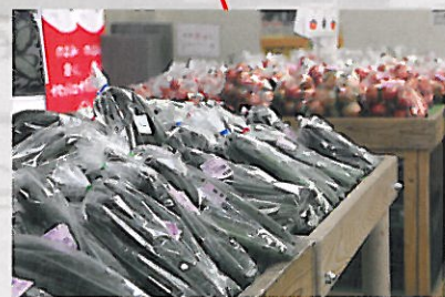
あぐりっ娘 地元的新鲜野菜・惣菜・生花 アイス(いちご狩り受付場所)