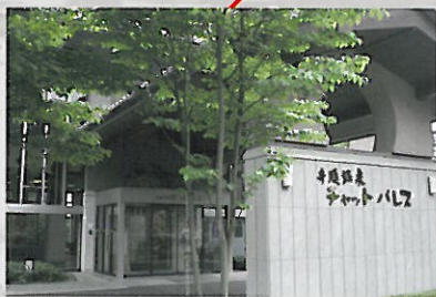
井頭温泉「チャットパレス」